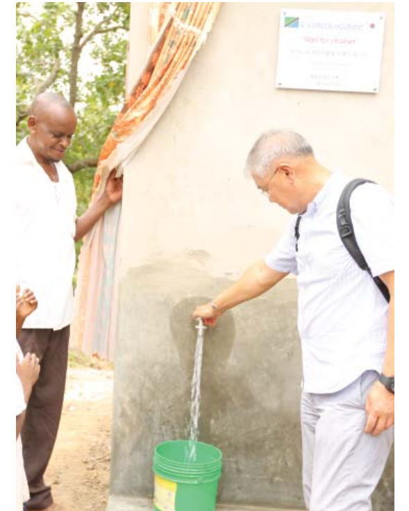
와! 우리 학교에 우물이 생겼어요.