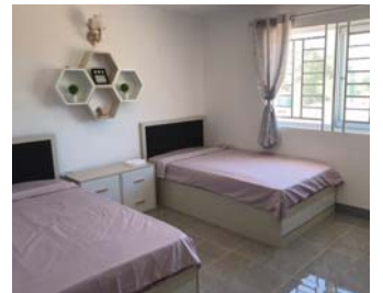
선교센터 건물 및 내부 사진