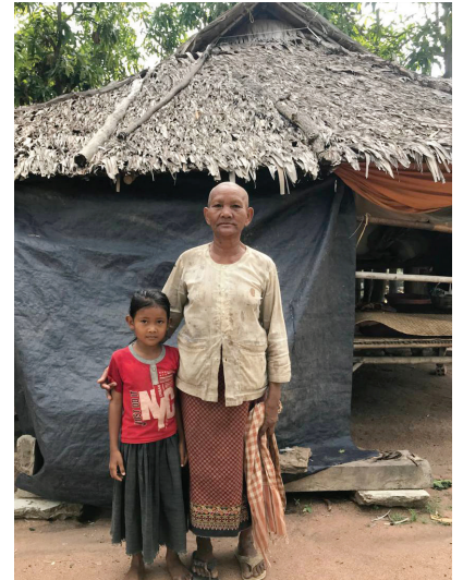
나무잎 지붕과 검정 비닐 가림막으로 만든 길거리 집