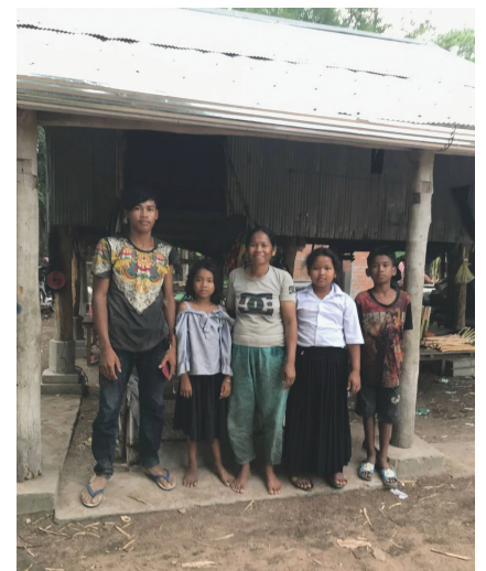
예수마을 근처 마을의 빈곤 가정들