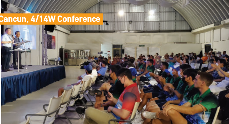
Cancun, 4/14W Conference