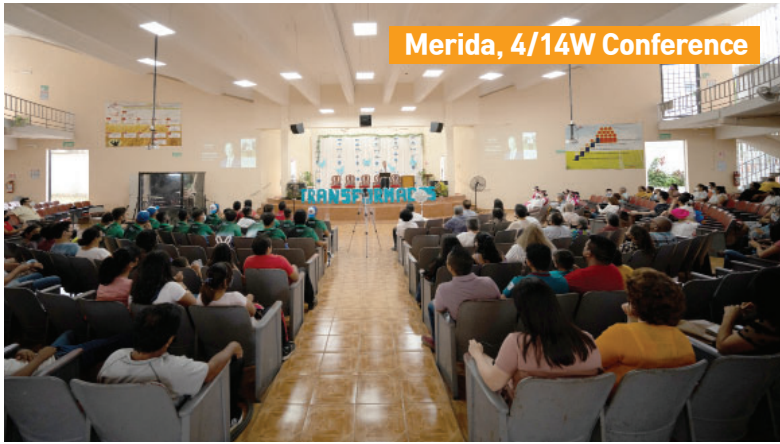
Merida, 4/14W Conference