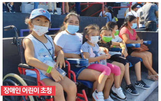
장애인 어린이 초청