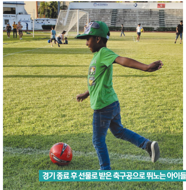
경기 종료 후 선물로 받은 축구공으로 뛰노는 아이들