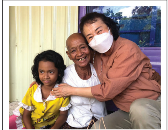
예수마을 주변 극빈자 가정 3차 심방 완료 후 16명이 예수님을 영접했습니다.

자립형농장을위한 프로젝트인 옥수수 시험 재배에 이어, 토질 및 환경을 고려하여 약 1ha 면적을 정지작업하여, 캄보디아에서 재배 및 판매가 쉬운 콩과 팥을 시험 재배 준비 중입니다.