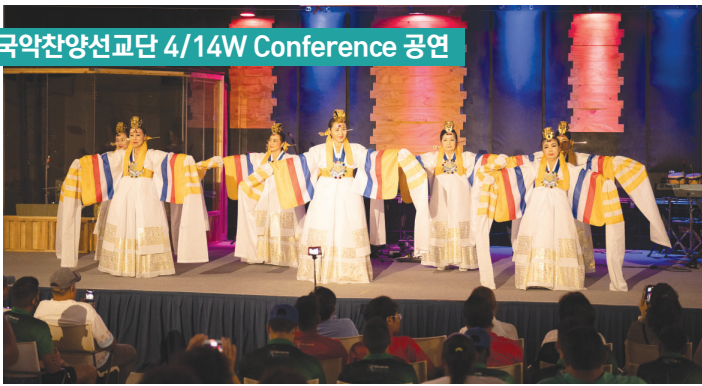
국악찬양선교단 4/14W Conference 공연